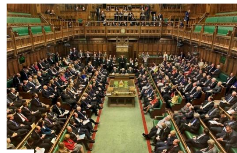
Рис. 3. Парламент Великобритании