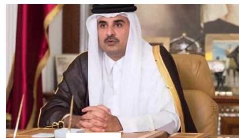
Рис. 2. Эмир Катара

В зависимости от полноты власти, сосредоточенной в руках монарха монархии бывают абсолютными и ограниченными. В абсолютных немногочисленных монархиях в руках монарха сосредоточена вся полнота власти (судебная, законодательная, исполнительная). Абсолютными монархиями, например, являются Ватикан, Саудовская Аравия, Катар (рис. 2). В большинстве современных монархий властные полномочия монарха ограничены